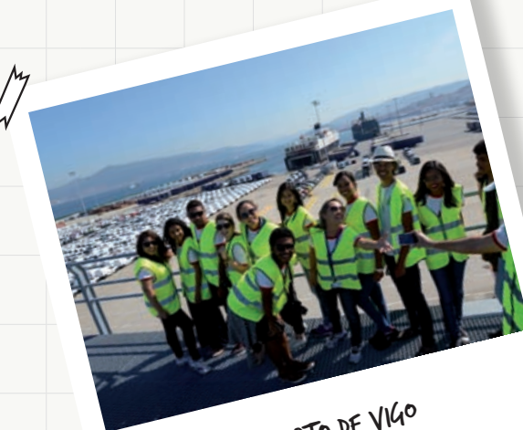
EN EL PUERTO DE VIGO