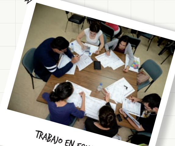
TRABAJO EN EQUIPO