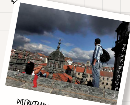
DISFRUTANDO DE LAS VISTAS