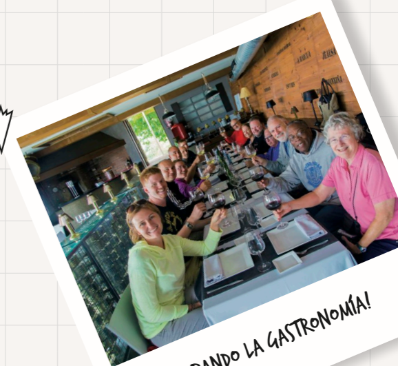
¡PROBANDO LA GASTRONOMÍA!